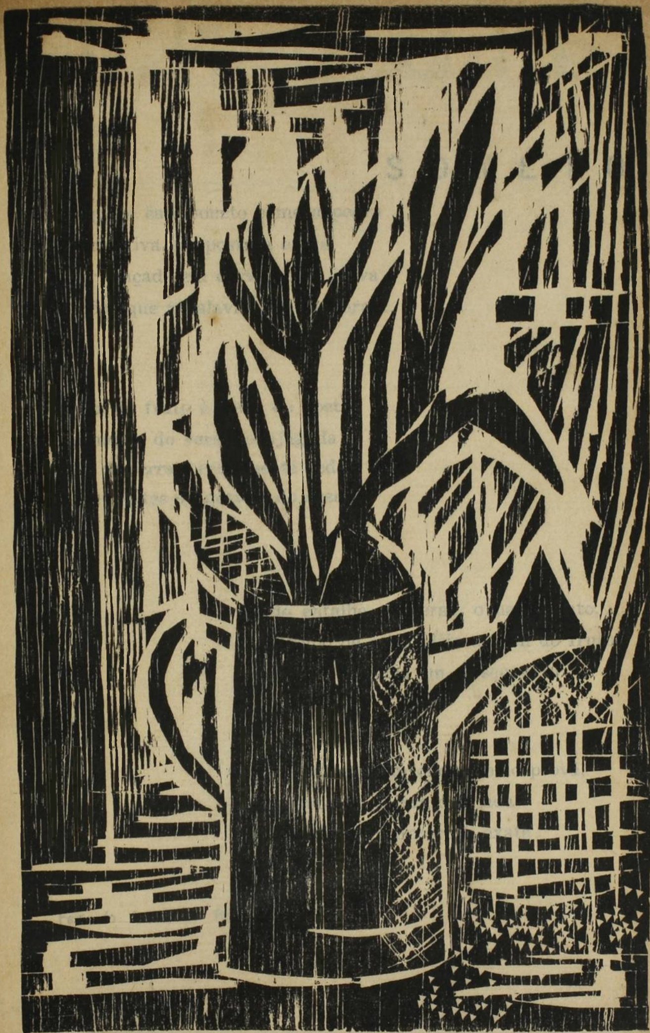
Xilogravura de Calasans Neto