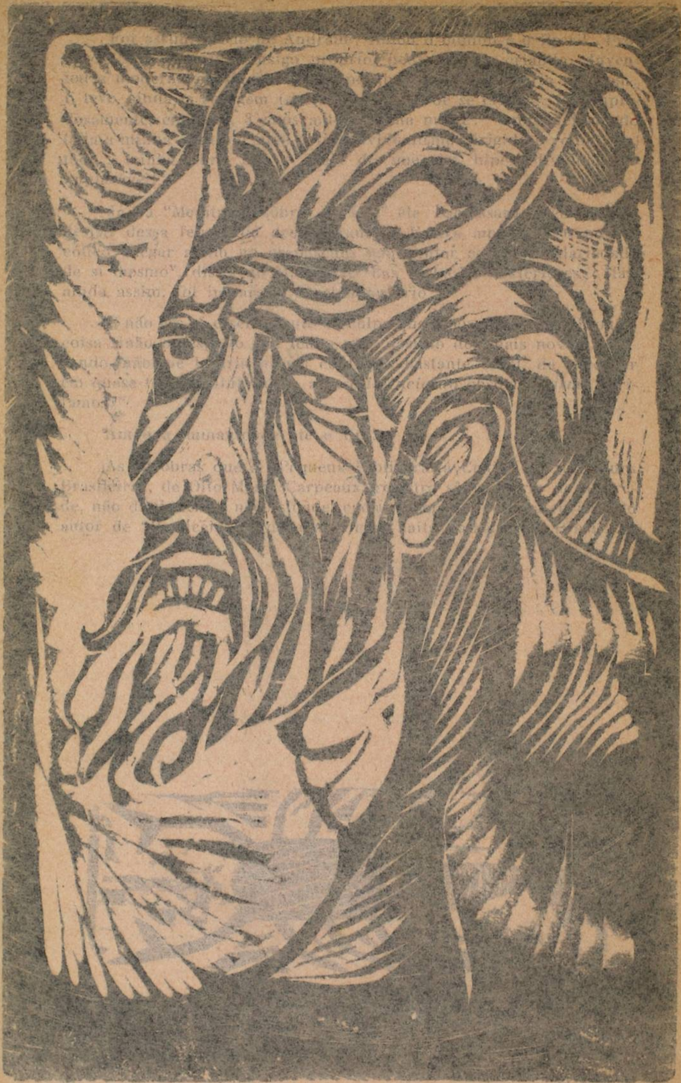
Retrato de Mário Cravo