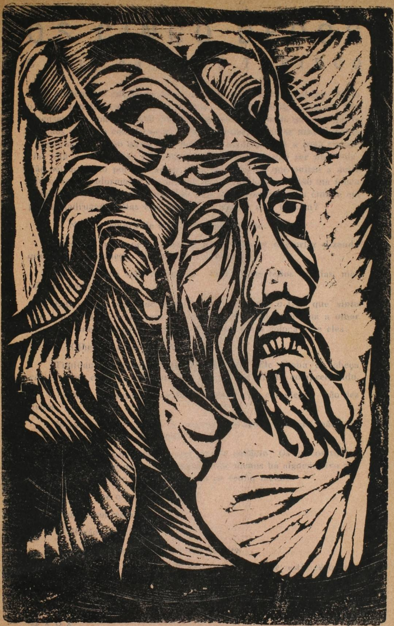
Linóleo de Mário Cravo