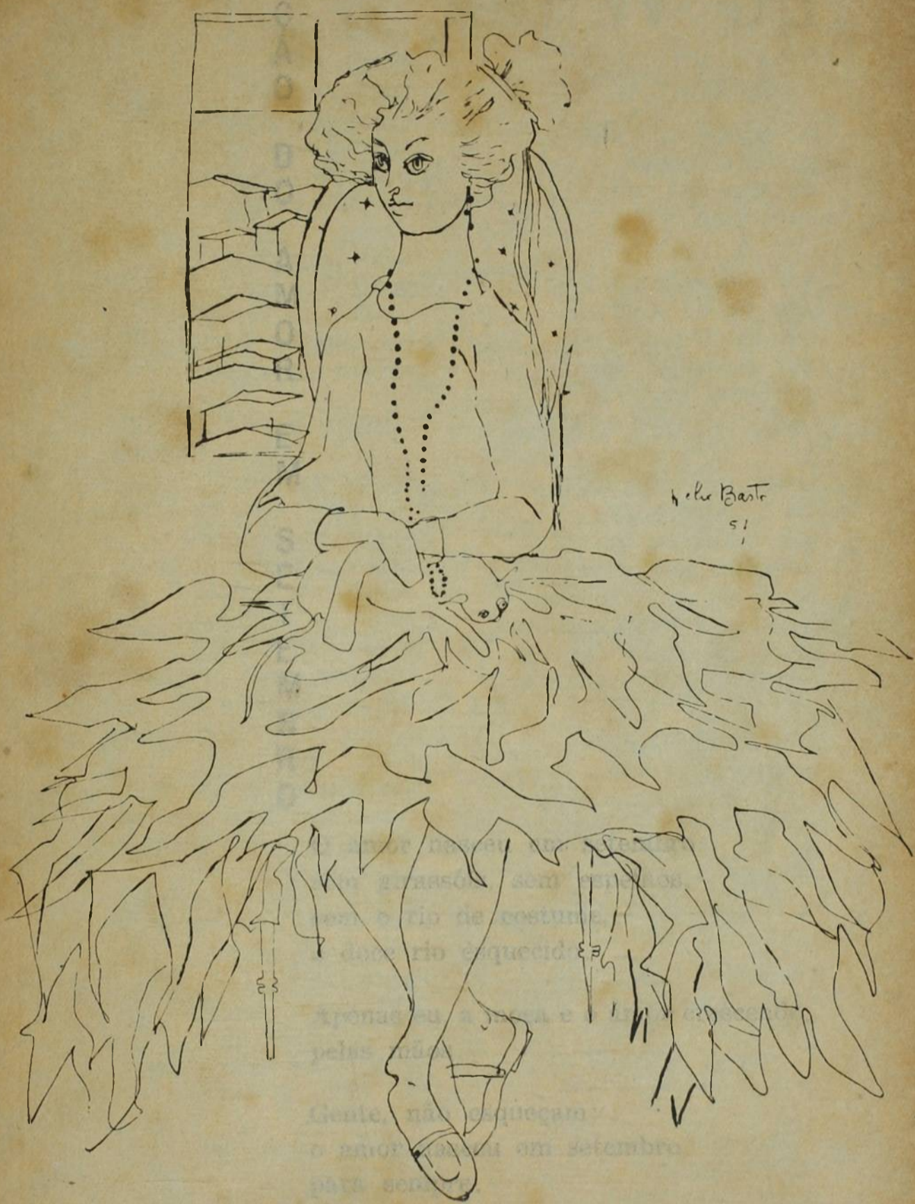
Figura — desenho de Hélio Bastos