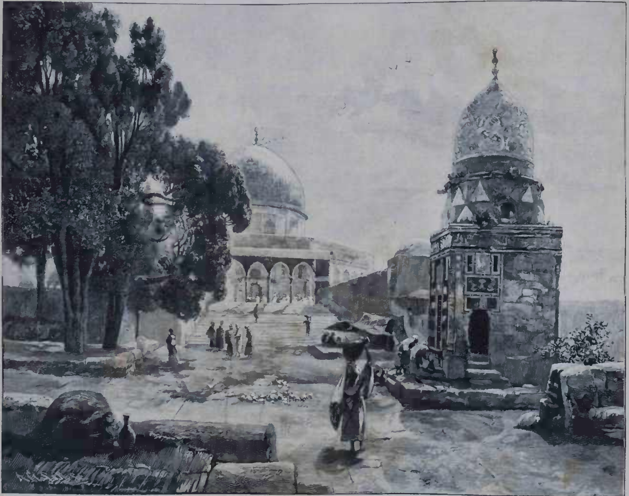
A SUBIDA PARA O TEMPLO DE SALOMAO

Os operarios de manufacturas são os unicos que tem o direito de usar, nas horas do trabalho, vestuarios cujo estado de limpeza não é completo, nem pode ser pela natureza de sua profissão.