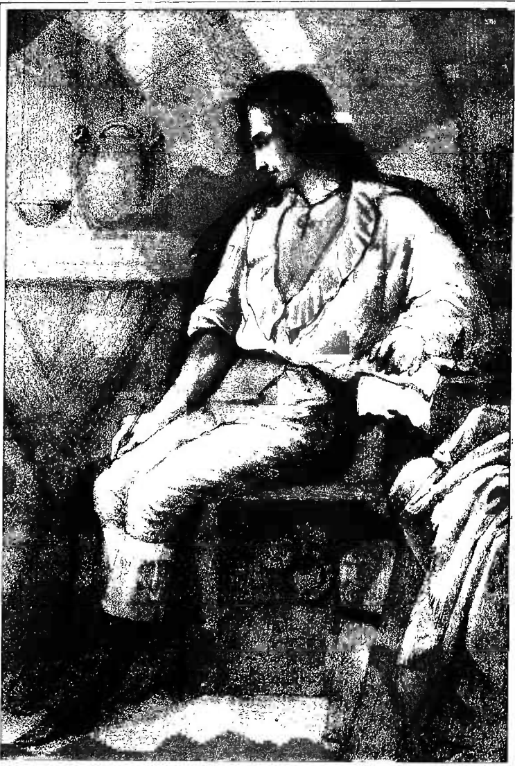
Imp. Caillat, call. Jacot, -0, Paris.